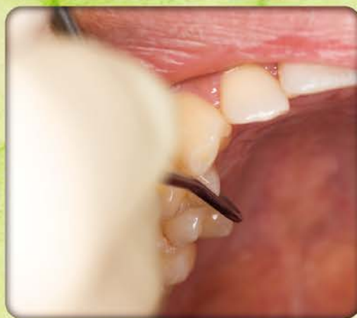
従来のシックルスケーラー