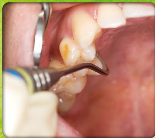
オフセットシックル N67