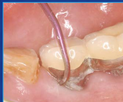
歯肉退縮によるインプラントカラー部露出の メンテナンスに。