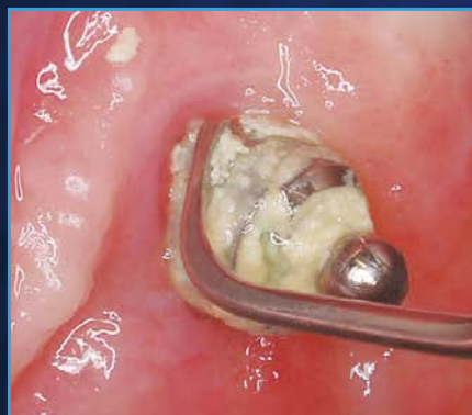
オーバーデンチャーのアバットメントの メンテナンスに。