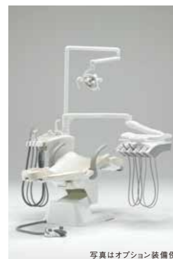
写真はオプション装備例