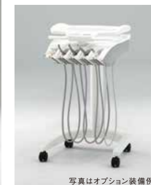
写真はオプション装備例