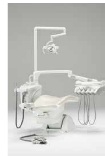
写真はオプション装備例