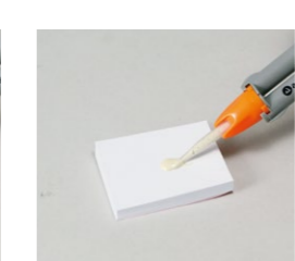
プランジャーを押すと自動練和されたMTAフィラペックスが押し込まれます。いつでも同等の練和状態が得られます。