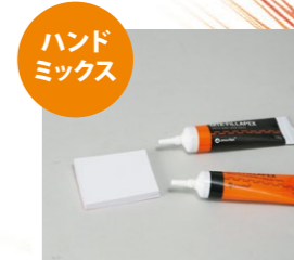
ペーストとキャタリストの比率 (容量) は1:1です。