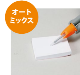
専用のミキシングチップを取り付けます。

オートミックスは約15回、 ハンドミックスは約200回を目安にご使用いただけます。