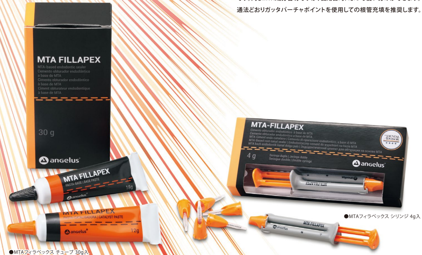
●MTAフィラペックス チューブ 30g入