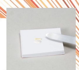
ペーストとキャタリストが均一になるまで30秒間練和します。