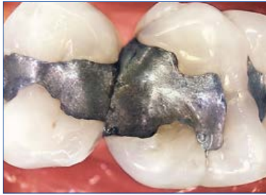
自動照度調整なので白歯部も明るく鮮明に撮影できます。