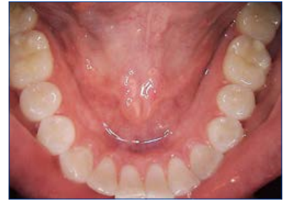
偏光プリズムレンズ搭載で光のハレーションを抑えます。