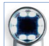
明るい部位撮影時

煩わしい調整を必要としないピント自動調整機構を搭載。撮影したい部位を的確に撮影します。8個のスーパー白色LEDは撮影に十分な明るさを提供。しかも撮影部位の照度に合わせて自動的に光量を調整します。