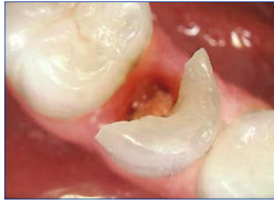
ピント自動調整なので隣接面カリエスなども簡単に撮影できます。