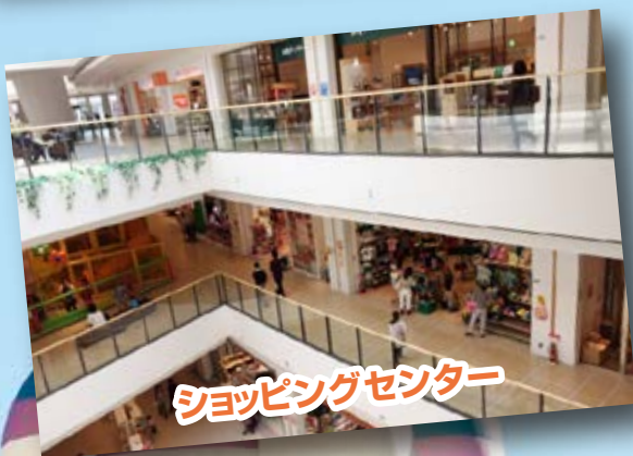
ショッピングセンター