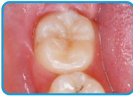
歯面清掃を行います