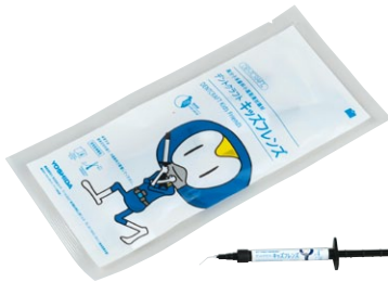
デントクラフト キッズフレンズ シリンジ単品