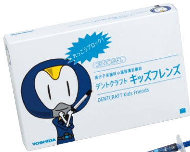
デントクラフト キッズフレンズ キット