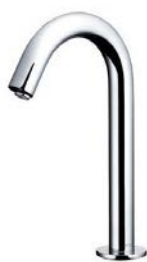
センサー式自動水栓