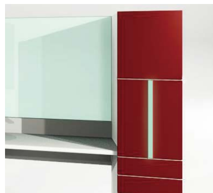
紫外線灯付収納キャビネット

標準仕様と同じ寸法に、上段に紫外線灯付キャビネットに変更可能。 (パッド12枚収納)