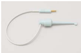
チャンネルインストゥルメントホルダー／1本