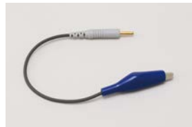
排唾管クリップ／1本