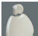
シャンパンホワイト