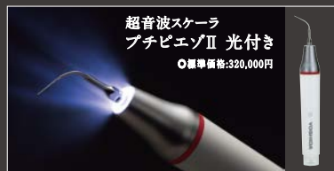
超音波スケーラ プチピエソII 光付き ◎標準価格:320,000円