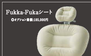
Fukka-Fukkaシート ◎オプション価格:185,000円