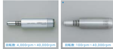
40DS-LUX(標準) 医療機器認証番号: 20900BZZ00110000(管理特管)