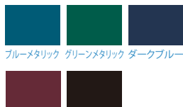
ブルーメタリック グリーンメタリック ダークブルー