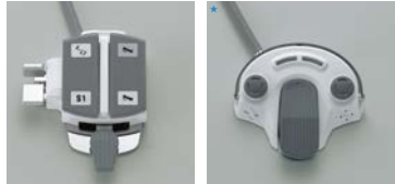
標準フットコントローラー