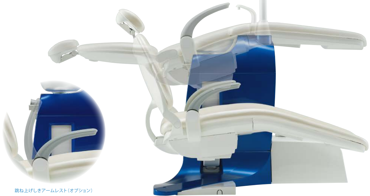
跳ね上げしきアームレスト (オプション)