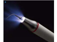
プチピエソII 医療機器認証番号: 220ACBZX00050000(管理特管)

スケーリングやルートプレーニングに使用できる超音波スケーラーです。フィードバック機能により、常に安定した発振をします。