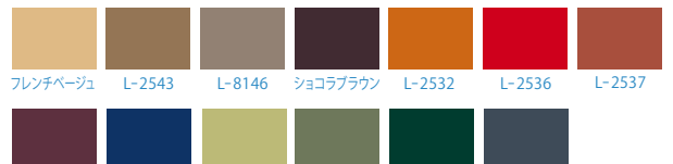
フレンチベージュ