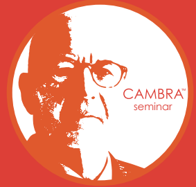
日本へ、地域へ、 これからの歯科医療プログラムを。

これからの予防歯科の新スタンダード 全米トップシェアのう蝕管理 「キャンブラ」を学ぶ、導入する。