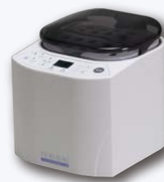
DC てきおん君 カートリッジ ホワイト