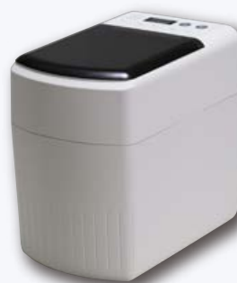
DC てきおん君 ホワイト

てきおん君ホワイト・てきおん君カートリッジホワイト共に、様々な寒天に対応できる6つのプログラムが予め記憶されています。フリープログラムは先生のお好みに応じて自由に設定いただけます。