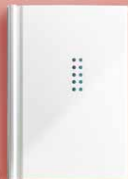
TYPE : 180(右開き)