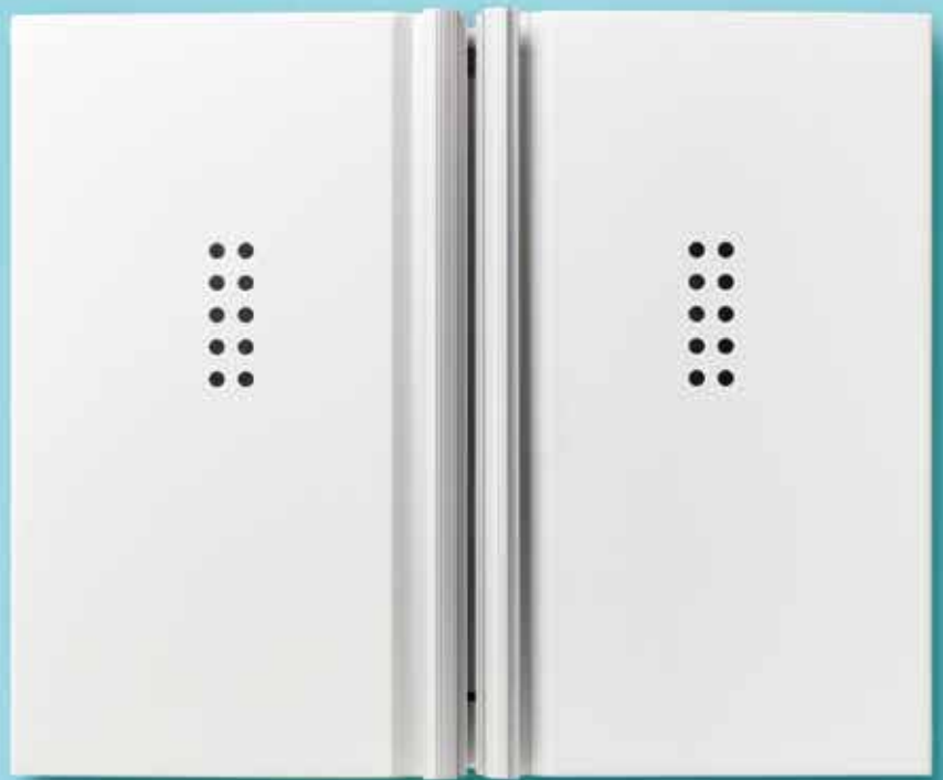
TYPE : 360

ヨシダの抗菌キャビネットは 機能性と使いやすさを追求した スマートな壁掛け式収納です。