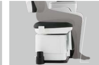
06 乗り降りしやすい インナーレッグレスト

乗るときはチェアに深く腰掛けられ、降りる ときは、子供から高齢の方でも立ち上がり やすい、インナーレッグレスト。