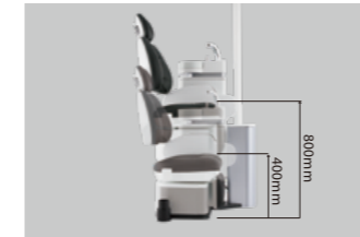
01 最低位400mm 最高位800mm

チェアに合わせてスピットン部も昇降するため うがい時にチェアの高さを戻す手間がありません。 立位でも自然な姿勢で診療可能です。