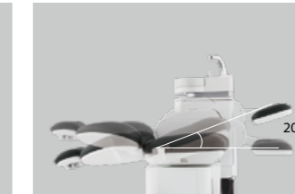
04 楽な姿勢で受診できる 単独チルティング機能

チェア全体が最大20度傾斜し、背中とお腹 の負担を軽減。楽な姿勢で診療を受けられ ます。