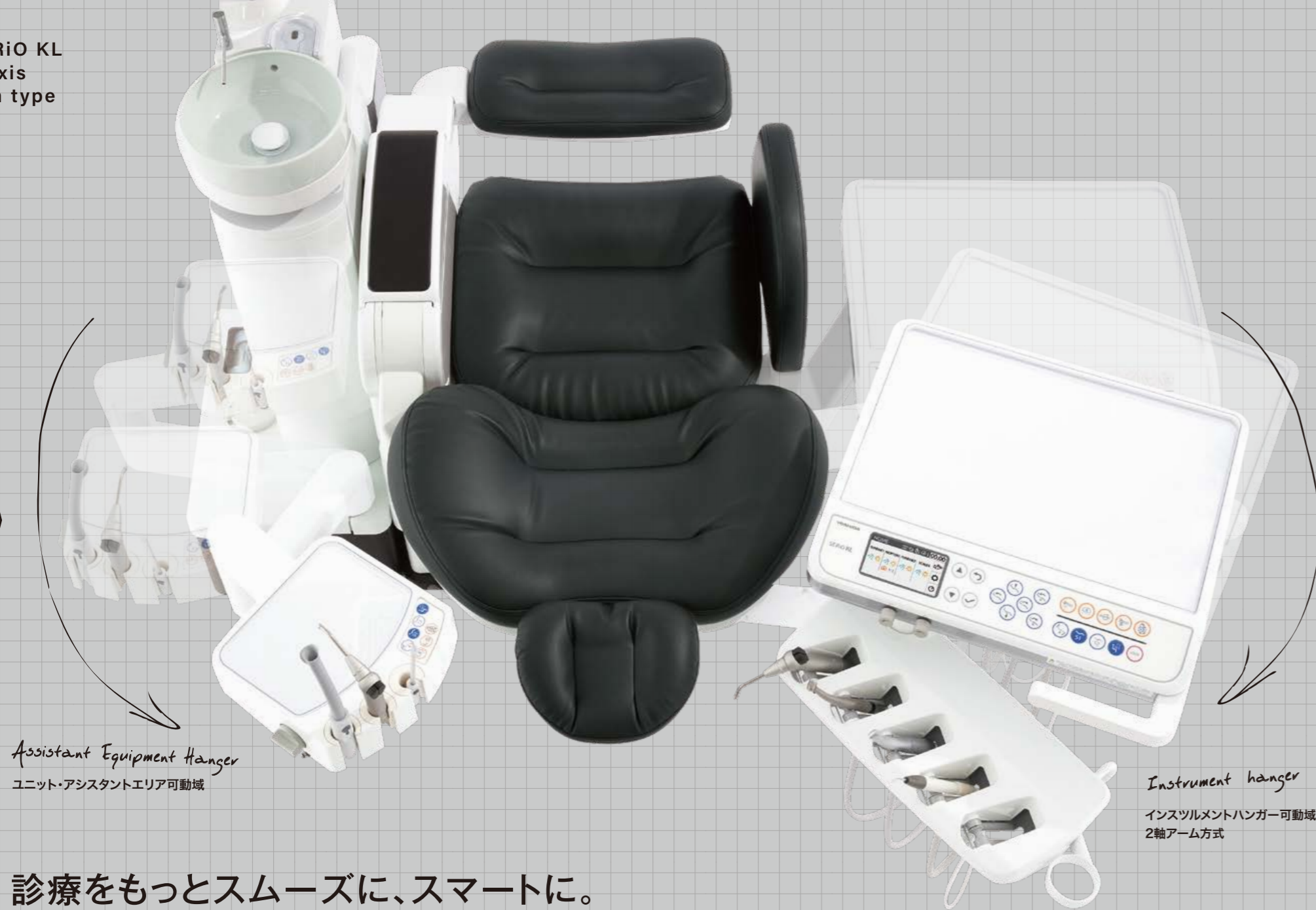
Assistant Equipment Hanger ユニット・アシスタントエリア可動域