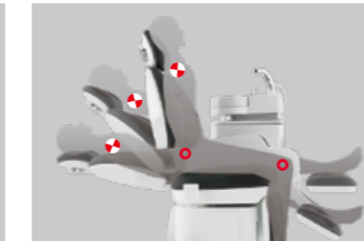
03 ポジションがずれにくい エルゴアクシズ機構

人間の関節とチェアの関節を同じ位置に 設定。チェアを寝かせても背中や頭がずれ にくくなりました。