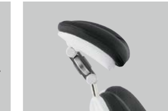
05 頸椎保持型 2軸ヘッドレスト

2軸可動式により、ゲストに合わせた頭部の 角度調整が可能に。頸椎を支え、開口しや すいポジションを得ることができます。