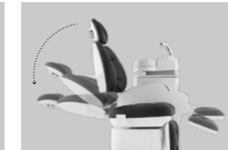
02 やさしくスタート&ストップ ショックレスチェア

チェアを動かす際の振動や音を大幅に軽減。 診療開始の緊張感を与えることなく、穏やかな 時間を演出します。