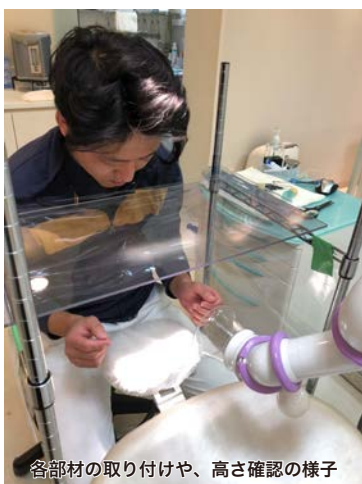
各部材の取り付けや、高さ確認の様子